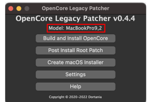
Bild1: Die Modellbezeichnung muss im Startbildschirm von einem andern als dem Zielgerät über die Schaltfläche «Settings» manuell eingestellt werden.

Zuerst müssen wir mit dem Befehl «Create macOS Installer» das neue Startlaufwerk (USB-Speicher oder externes Laufwerk) erstellen. Wir haben dabei die Möglichkeit, den Installer bei Apple herunterzuladen oder einen bestehenden Installer (der sich im Ordner Programme des Mac befinden muss) zu verwenden. Danach folgt man einfach den jeweiligen