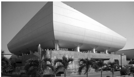
National Theatre, Accra