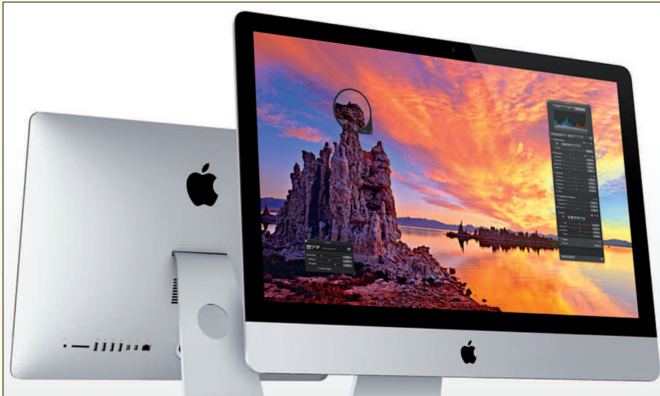
Der aufgerüstete iMac präsentiert sich elegant und leistungsstark.