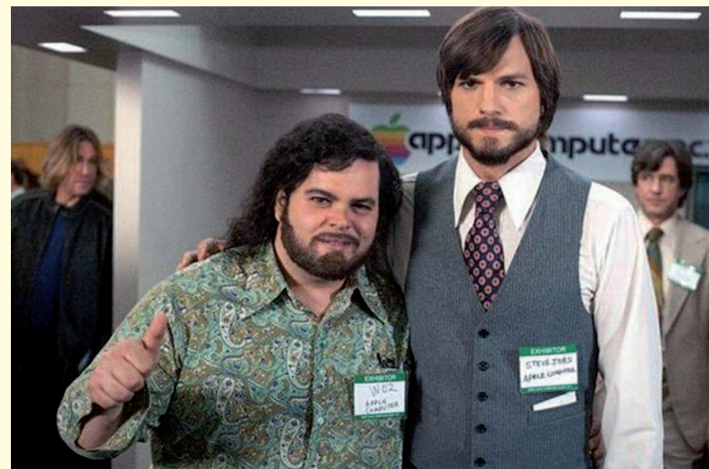
Szenen aus dem Film «Jobs»: Ashton Kutcher als Steve Jobs zusammen mit Josh Gad als Steve Wozniak.