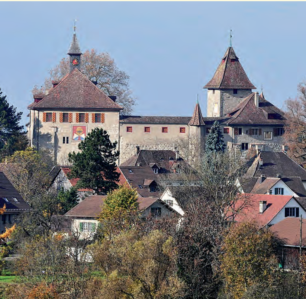
Die Kyburg – ein Wahrzeichen der Kultur- und Industriestadt Winterthur.