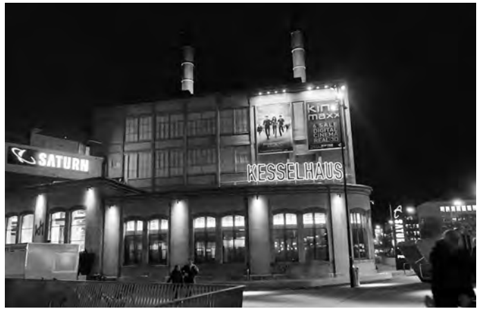
Das Kesselhaus auf dem Sulzer-Areal in Winterthur vor und nach dem Umbau.