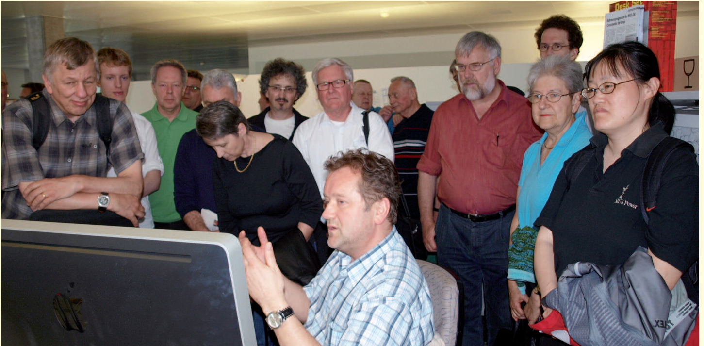
Ein Blick hinter die Kulissen der Coop-Zeitungsproduktion.