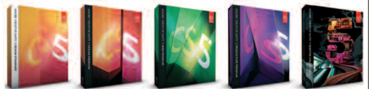
EDITIONS OF ADOBE CREATIVE SUITE 5